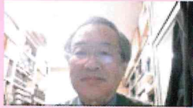
全地区 テレビ会議等で連携